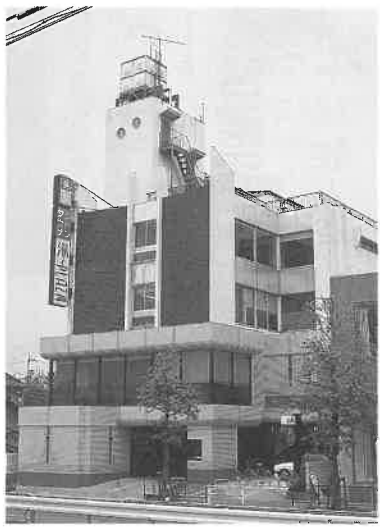
地域の人たちに支持され親しまれている湯～PLAZAの外観