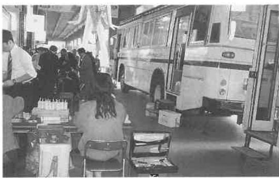
▲名古屋駅名鉄セブン前で