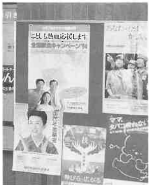
▲福岡県水巻町役場に掲示された協会の献血ポスター