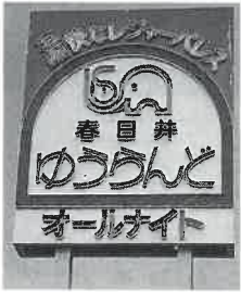
▲明るいイメージの外観とR19パイパスからよく見える大看板

域の企業オーナーや従業員など。時間帯によっては学生や主婦も結構来ている。平日は七、八百人、土日祝には千四、五百人にのぼるにぎわいである。