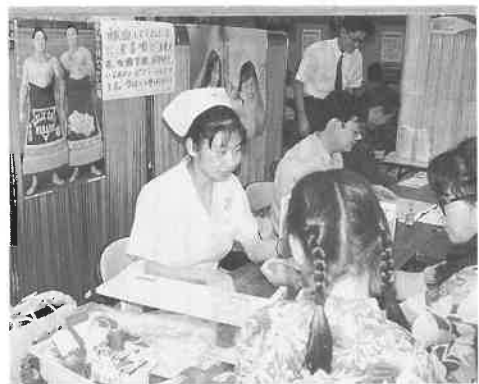
▲岡山市表町の献血ルームで