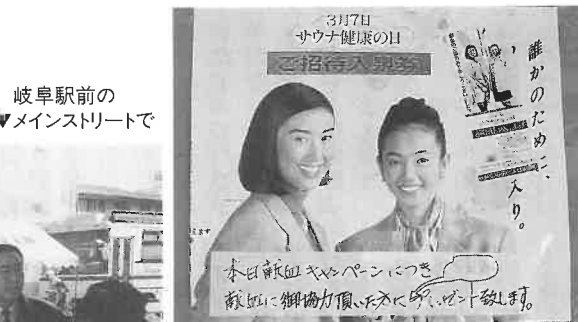
▲大阪・京橋献血ルームは4階にあり、1階の入口に掲示された協会の献血キャンペーンの案内。ここでの献血者はサラリーマン、事業主が60%、学生15%、その他主婦などで、サウナ招待券が喜ばれているという。

によって音が微妙に変わるからだ。また、マイクに汚れやへこみがないか点検する。お客さんへの細かい気くばりである。準備OK。予約番号と名前を呼ばれたお客さんがいそいそとステージに向かう。