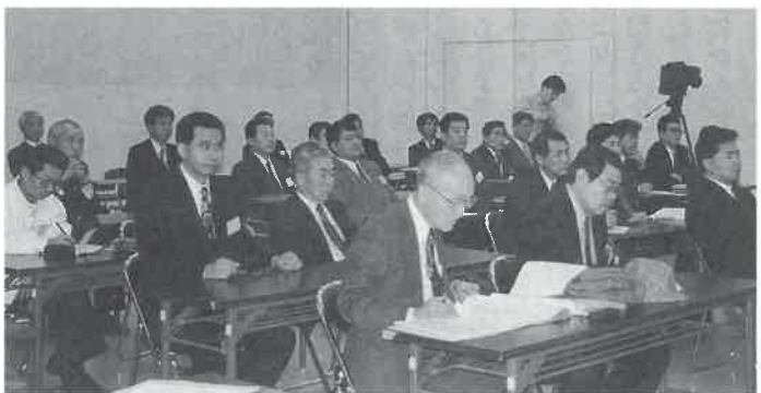
趣旨に賛同して参加された会員や関係者の皆さん方