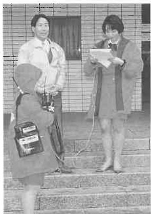
▲福岡・天神—RKBラジオの取材

をからしての呼びかけ、熱心な献血協力者の群、満席の採血コーナーなどの献血風景を放映。 多くの人たちの共感を得ながら「二万人献血」へ九州ブロックの奉仕活動は、ところによっては三月いっぱい続く。