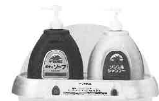
(レギュラータイプ)ボディソープ・リンス&シャンプー ラベルが湯気にもはがれないインモールド成型で体感シーンをバックアップ

株式会社 796化学 〒453 名古屋市中村区沖田町390番地 TEL.(052)471-1111 FAX.(052)471-1112