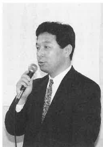
コインオペレーションが 商売の基本です。