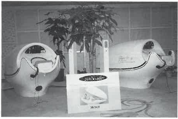
ニュージャパンサウナ道頓堀店

操作している。 ここではコインシステム(フロントでコインを買)を採用し、千八百円で二十五分間使用できる。 導入初日から予約客が殺到し、平日にもかかわらず予約漏れのお断り客が多数で始末。(写真を参照) これは、既にお客様がエステティックマシンあるい