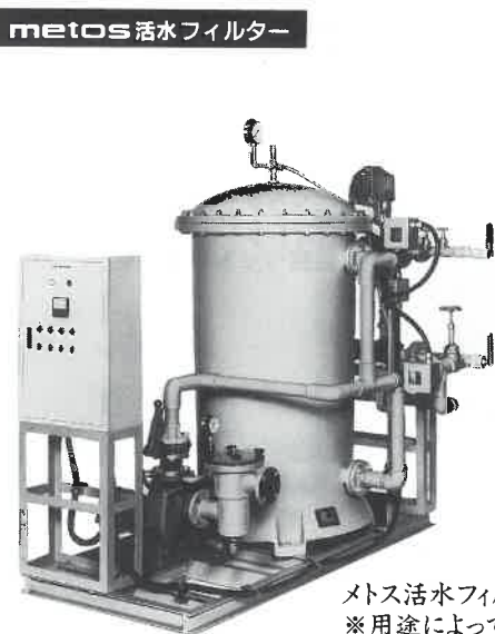
メトス活水フィルター(FRP製全自動) ※用途によって各種濾材が選べます。

株式会社日本ブライダルセンター 神奈川県川崎市川崎区元木1-5-16 アサヒ元木町ビル TEL (044) 211-9750 FAX (044) 211-9735