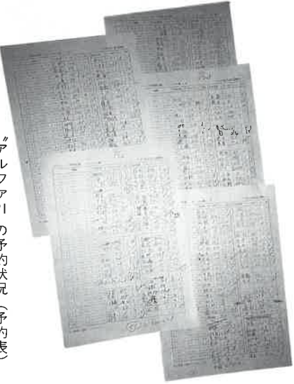
アルファ21の予約状況(予約表)

そのうえで、温泉利用型健康増進施設は ① 健康増進のための温泉利用を実践するための設備(かぶり湯、全身浴槽及び部分浴槽、気泡浴槽、圧注浴槽等、箱蒸し・サウナ等)を備えていること ② 温泉利用に関する基礎的な知識及び技術を備えた者(温泉利用指導者)を配置していること ③ 温泉利用型健康増進施設は、健康増進のための温泉利用を実践するための設備(かぶり湯、全身浴槽及び部分浴槽、気泡浴槽、圧注浴槽等、箱蒸し・サウナ等)を備えていること ④ 医療機関と適切な提携関係を有していること ⑤ 継続的利用者に対し