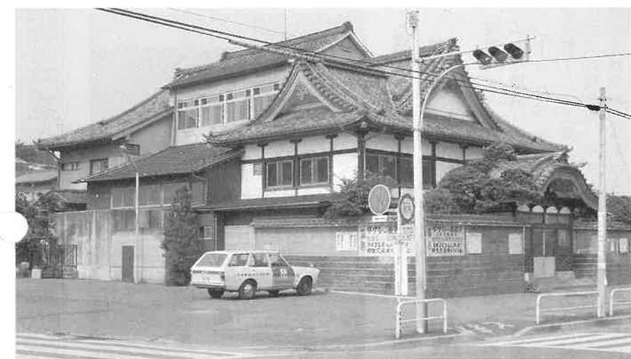
東京都足立区で盛業中の銭湯。昭和初期の建築といわれる。社寺を思わせる堂々たる「唐破風」(からはふ。屋根に付いている、そり曲がった曲線状の破風)が立派。太平洋戦争の東京大空襲に生き残った貴重な庶民の文化財といえる。見学はお断りしているが、入浴して、じっくり眺めるのは歓迎とのこと。

また、「銭湯」の語源も本質的には洗湯であるが、銭を取ってつかはしむる湯という意味において銭湯である。戦後、湯銭も円単位になってきたので、円湯ではないかと言われるふしもあるが、なぜか、現在も銭湯の呼び名で親しまれている。こんな話もある。青森県外ヶ浜地方に「雁風呂」と称して、暮春のころ、海岸に落ち散らばっている木片を拾い集めて風呂を焚き、人々に入浴させる風習がある。これは秋に渡って来る