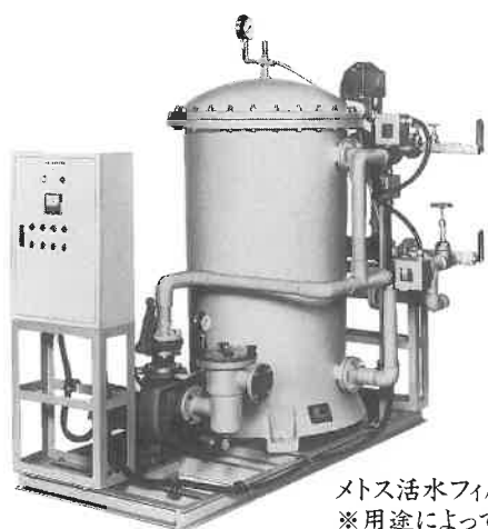
メトス活水フィルター(FRP製全自動) ※用途によって各種濾材が選べます。

『水』改革。 リゾートやレジャー施設、スポーツ、健康施設、そして日常の生活にとつて「水」はますます重要な役割を占めています。メトス「活水」フィルターは性能、耐久性、経済性と三拍子そろった画期的な循環濾過機で、当社の長年にわたる研究開発と七〇〇台に及ぶ納入実績。これはお客様に確かな信頼の証しです。 — 水は文化のパロメーター。