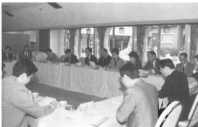
レポートを提出して活発に質疑が

関西サウナ協会主催「第二回幹部研修会」が三月十八日午後一時から、ニュージャパン観光(大阪市中央区道頓堀二)の七階会議室で開催され、会員店十四社