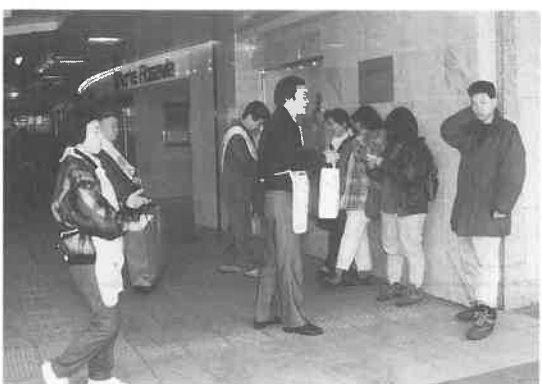
阪急京都線茨木市駅で