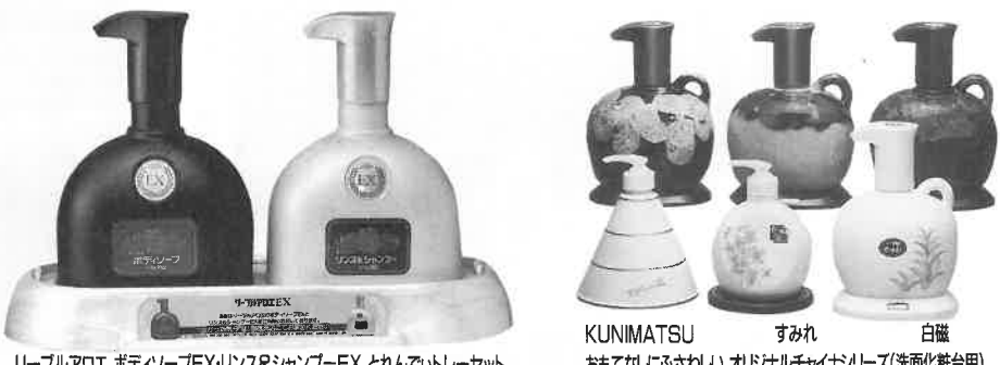
リーブルアロエ ボディソープEX・リンス&シャンプーEX とれんていトレーセット KUNIMATSU すみれ 白磁 おもてなしにふさわしいオリジナルチャイナリンス(洗面化粧台用)