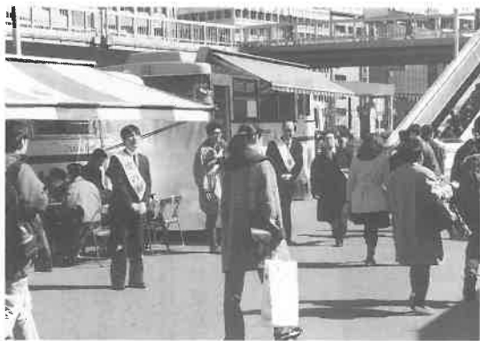
JR大阪駅御堂筋口前で