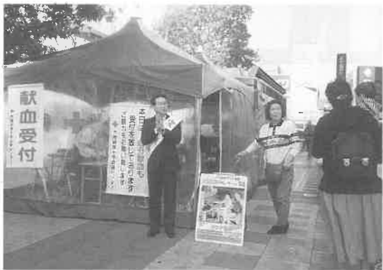
難波グリーンガーデン高島屋前で