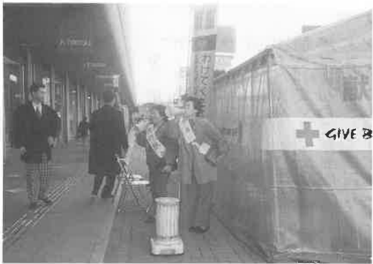
あべの高速バスターミナル前で