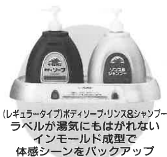
レギュラータイプボディソープ・リンス&シャンプーラベルが湯気にもはがれないインモールド成型で体感シーンをバックアップ