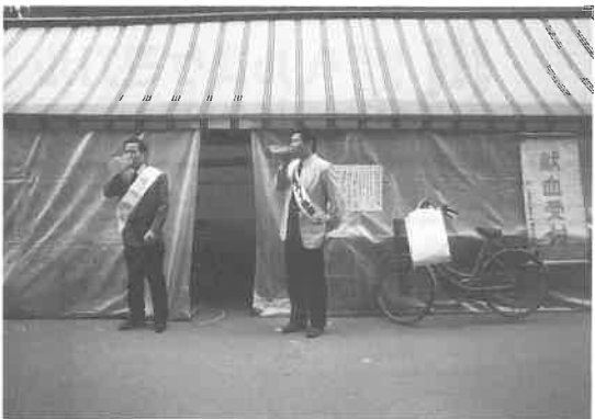
京阪枚方市駅前で