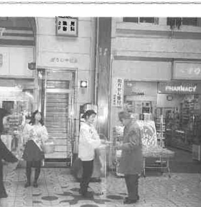
姫路・御幸通り献血ルームで

四国支部(四国サウナ協会・深田初王会長)は、二月二十六日午前十一時から高松ロイヤルパークホテルで「総会」を開催。徳島、高知、松山、高松から会員五社八名、事務局二名の計十名が出席した。資格問題、共通入浴券、