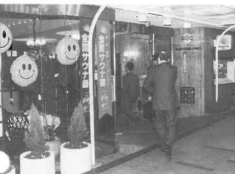
▲にぎわう大阪・ニュージャパンの玄関

へ来年も実施してもらいたいなど、前向きであった。その中で、展示できる賞品がなくお祭りムードに欠けるなどの声もあった。