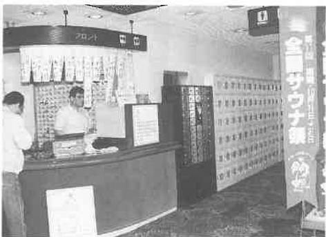
▲当選者名を掲示した東京「東泉」のフロント