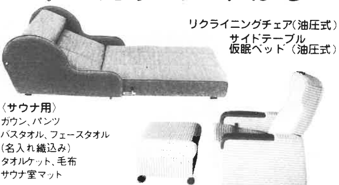
リクライニングチェア(油圧式) サイドテーブル 仮眠ベッド(油圧式)