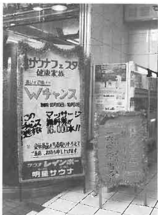
▲東京「レインボー」のサウナ祭の看板