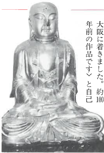
手を合わせ、さい銭を供えるお客さんも多い。なかには「競馬にご利益がある」と信仰を深めている男性もいるとか。女性にとくにもてる。

大阪の健康サウナ・ランド温泉「アベノドック」(阿倍野区松崎町二)の入口におわす「頭振り大仏」さん。立札に「日本に一体しか有りません。はるばる中国の上海より大阪に着きました。約100年前の作品です」と自己紹介。金色に輝く像は高さ約二メートル。つねに頭を前後にゆっくり振っており、あれ「いらつしやい」とも願いごとに「よしよし」とうなずかれています。にも受けとれる。