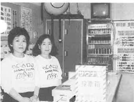
▲サウナ祭Tシャツ姿で大阪「アベノドック」