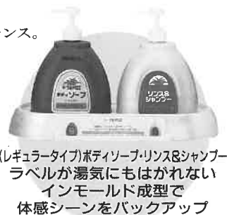
(レギュラータイプ)ボディソープ・リンス&シャンプーラベルが湯気にもはがれないインモールド成型で体感シーンをバックアップ

KUNIMATSU すみれ 白磁 おもてなしにふさわしいオリジナルチャイナシリーズ(洗面化粧台用)