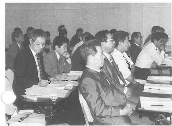
講師の話にひきこまれる

安いのがうけています。このように男女混合、男女近接がもっと進むだろう。そして、そのベイスにあるのが、お互いにコミュニケーションをよくしたい、つまり仲良くしたいということにありまふ。さらに言えば、美しく健康でいたい、おしゃれをしてデートをしたい……といったことが中心になっていると思えます。