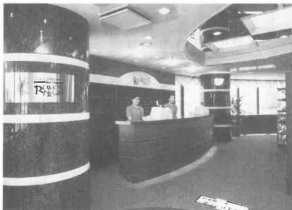
フロントの感じのしゃれた

午後三時、来年の再会を約束しながら、お年寄りたちに見送られて帰途について開店披露が行われた。