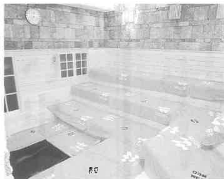
「足浴サウナ」が設けられた遠赤外線サウナ室