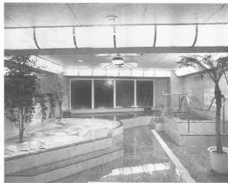
ユニークなお風呂が揃った浴室

日本では初めての「足浴サウナ」が二部屋。こ、は食事、マッサージもできる。このカプセルのエリアの中にインフォメーションが設けられ、係員が交代で二十四時間詰めている。その役目は、特別室からの呼び鈴コールに対応してのサービスもするが、実は何よりも防災のための備えと、また、トラブルを防ぐという面からも、お客様の安全に気配りした管理システムの一つでもある。