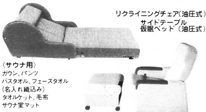
リクライニングチェア(油圧式) サイドテーブル 仮眠ベッド(油圧式)

〈サウナ用〉 ガウン、パンツ バスタオル、フェースタオル (名入れ織込み) タオルケット、毛布 サウナ室マット