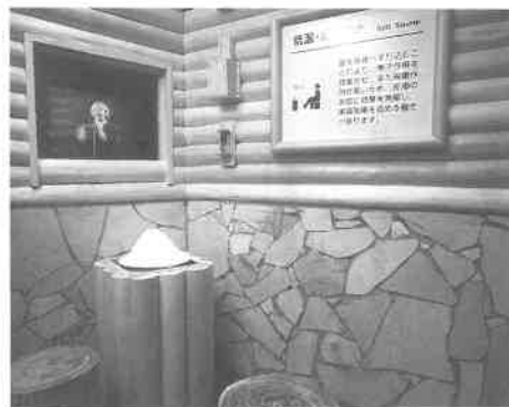
「塩サウナ」発汗作用のほか殺菌、美容にも効果