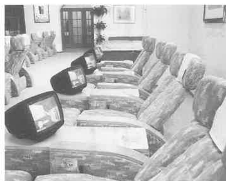
ゆったりくつろげるラウンジ

「サウナウエルビー福岡」のレイアウトの特色は、まず、お客様が一方方向に流れるように動線を考えてある。それと、フロントから入って各部屋があるというよりも、各部屋それぞれが一つのお店といったコンセプトで構成されている。つまり、フロントからロッキングのエリアを経て、マッサージのエリアを横目で見ながら浴室へ。そして浴室を出た正面がマッサージルームの入り口といった具合。お風呂もユニークなものを揃えている。その代表は