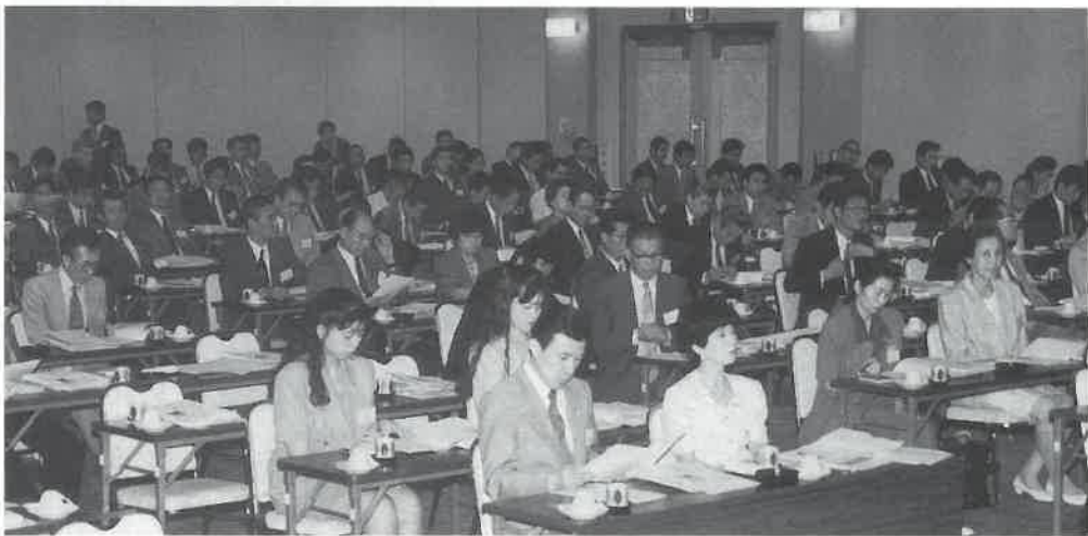
広い会場を埋める盛況。議事進行に拍手。講演に聴きいる。

勢約二百五十名が出席して午後二時から、同ホテルのコンベンションホール・光輪で開催され、広い会場を埋める盛況ぶり。