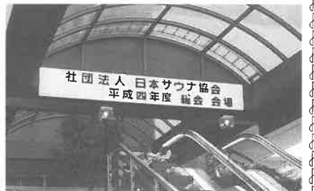
▲会場になったホテル玄関