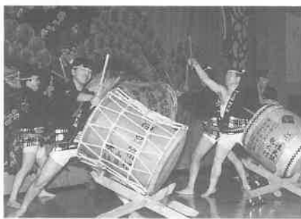
▼豪快な箱根の函嶺太鼓