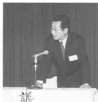
▲議長を務める米田会長代行

広いコンベンションホールは全国から出席された会員の皆様で埋まり、和やかなムードのなかで議事の審議が行われ、また講演に耳を傾けた。