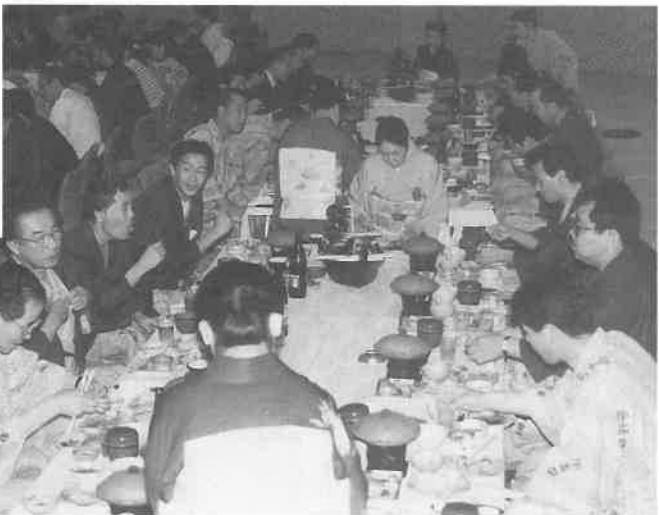
▲美味に舌つづみ、話もはずむ