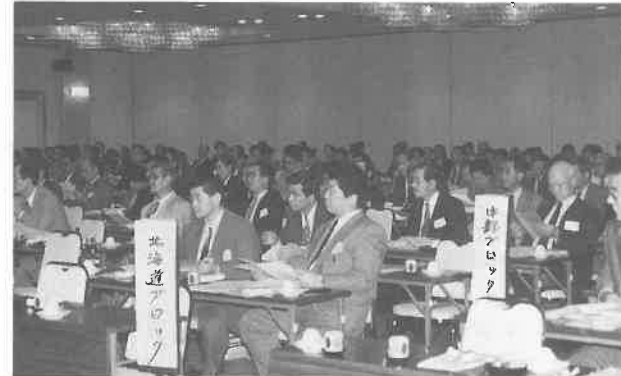
▲ブロックごとに席を占めて