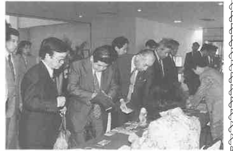
▲総会出席者の受付