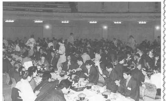
▲宴会もたけなわに