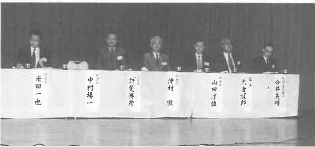
▲壇場の本部協会役員