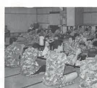
写真はくつろいで懇親会

り年末年始の営業日、特別料金、企画などの報告が行われ欠席会員には後日資料を送ることとした。 平成四年三月七日サウナデーの全国統一献血キャンペーンは、事務局より運動拡大の報告があり、名古屋、岡崎、岐阜の三方所を実施、各地区の責任分担を依頼、千人〜千数百人の献血者を目標に展開する方針。