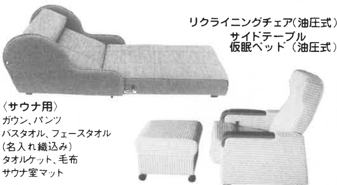
リクライニングチェア(油圧式) サイドテーブル 仮眠ベッド(油圧式)

〈サウナ用〉 ガウン、パンツ バスタオル、フェースタオル (名入れ織込み) タオルケット、毛布 サウナ室マット