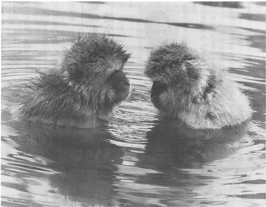
ご猿を大切に！ 長野県山内町の地獄谷の温泉につかり、新年のあいさつを交わす!? ニホンザル