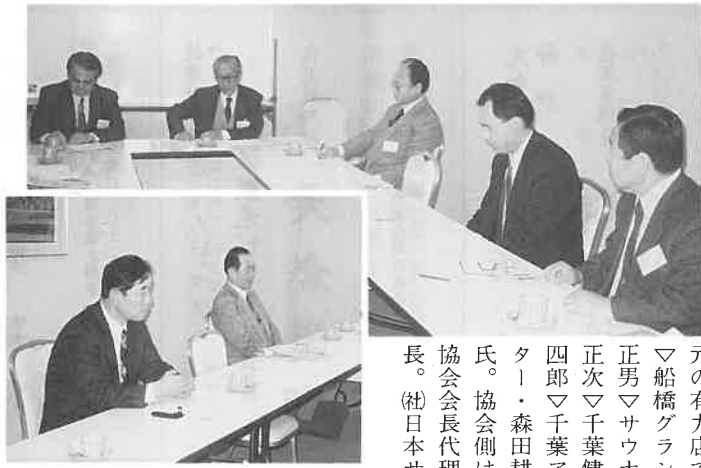
12月20日千葉県健康ランドで開催された「千葉県支部発足懇談会」で活発に意見交流が行われた。

年末も押し迫った十二月二十日、各県に支部づくりの会員拡大方針にそって、千葉県支部発