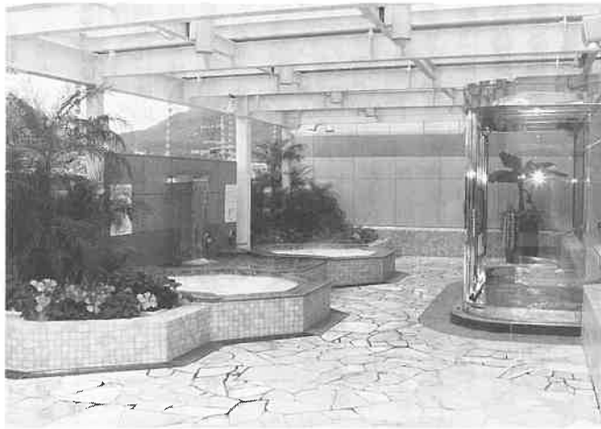
心までリフレッシュできるサウナゾーンには乾式サウナ、ミストサウナをはじめ最新のいろいろな楽しいお風呂が揃っている。