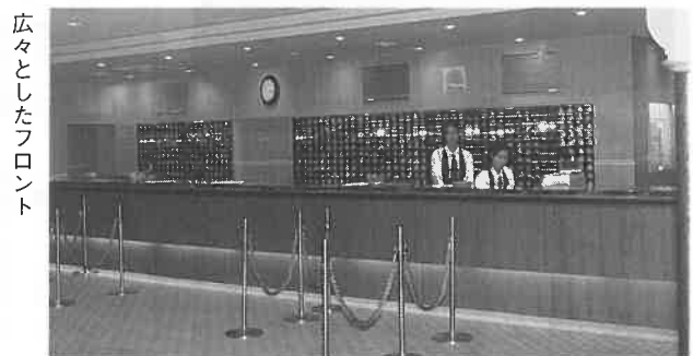
広々としたフロント