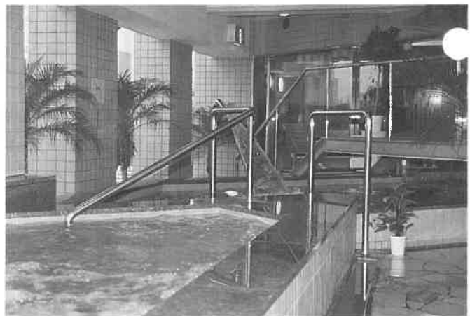
ジャグジーバスの一部がベランダに張り出して露天風呂になっている。このほか、いろいろ楽しいお風呂が揃っている。