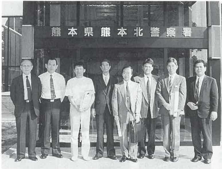
10月3日熊本北警察署で「財団法人熊本県暴力追放協議会」への 全員入会手続きを済ませた熊本県サウナ協会の会員