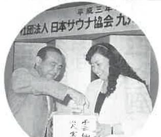
雲仙・普賢岳被災者に見舞金の手渡された。

(2) 継承事業の拡大発展として ● 三月七日サウナ健康の日献血キャンペーン ● 学生の拡充強化 ● 厚生年金基金制度の勉強会の開催