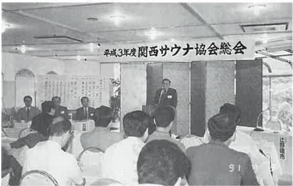
平成3年度関西サウナ協会総会

次いで中野会長が挨拶。国際サウナ会議への厚い協力に改めてお礼を述べ、「……四十年前も前からヨーロッパの各地で国際会議が開かれていた事実を見ると、わが国のサウナはずいぶん遅れていたわけです。その意味で、今回の