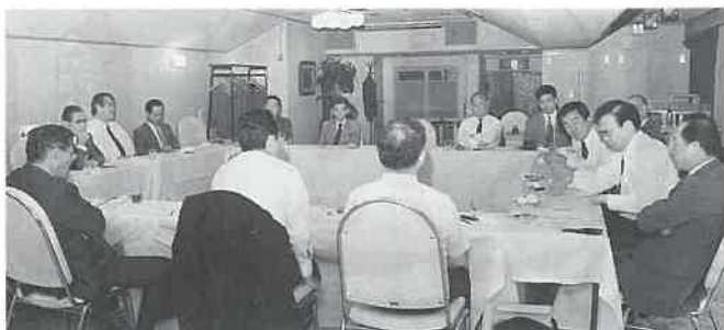
第6回理事会の会議風景

買収資金五百万フラン(一億五千万円)。新会社ソフィア・フランスを設立のうえ今年十一月に正式調印の予定。また同店の従業員(十八人)の半数を日本に呼び、東京と札幌に一店ずつ、モーリスの店を出す計画である。なお、これを機会に六月に社名をソフィア中村からソフィアに改めた。