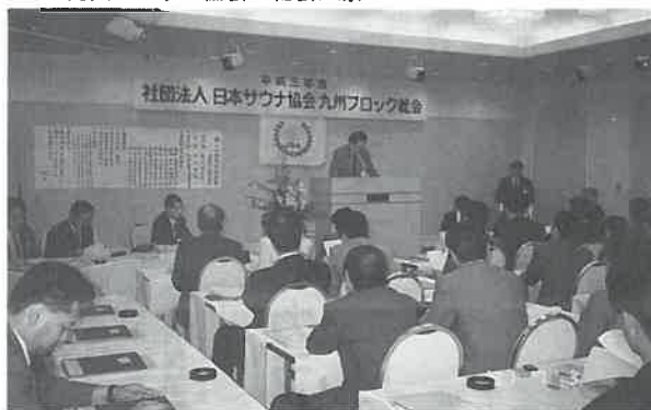
九州ブロック協会の総会風景

の實施 ▽会員拡大など組織強化と本部および会員間の連携を強化 ▽教育・研修および調査、情報交換など積極的に行う ――など総合的に展開することと承認された。