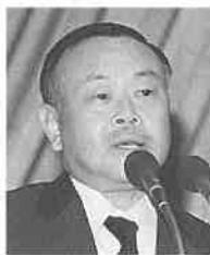
国際サウナ会議各国代表講演