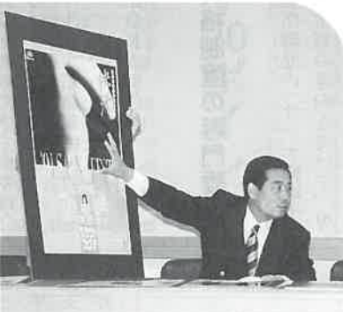
▲駅貼りの大型ポスターの説明