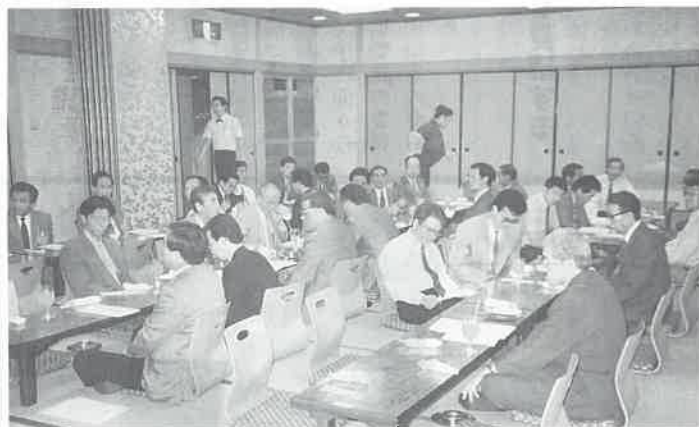
総会後の懇親会。会員および賛助会員の名刺交換など親睦を深める