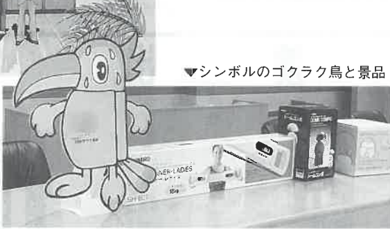
▼シンボルのゴクラク鳥と景品