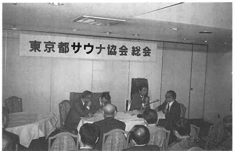
東京都支部総会。議事、新入会員紹介、懇親会と活発に和やかに進行

・会員拡大(賛助会員含む) ・サウナ事業に関する研究会、事業所見学 ・トレーナー、管理士の研修会 講演の後、同会館で懇親会が開かれ、賛助会員の紹介、挨拶があり、和やかに懇親が重ねられた。