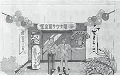
▲全国サウナ祭の各店の装飾企画