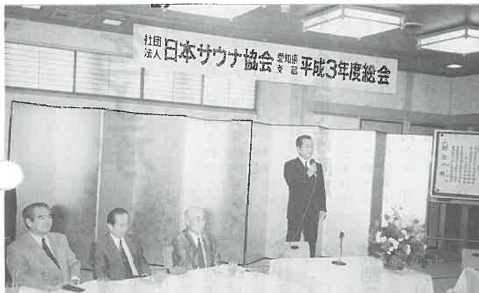
岡崎健康ランドで開かれた愛知県総会