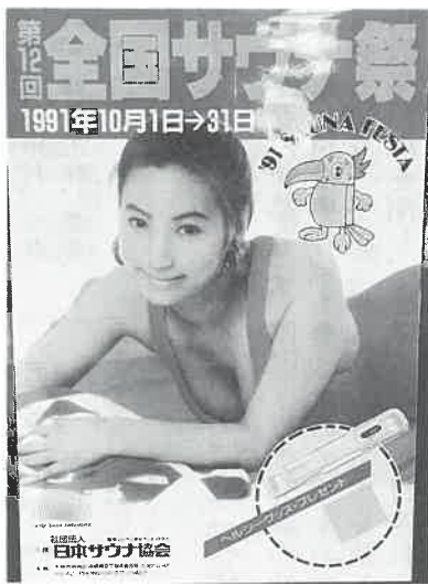
▲先取りした第12回のポスター