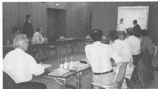
大塚製薬の工場・研究所見学で説明を聞く