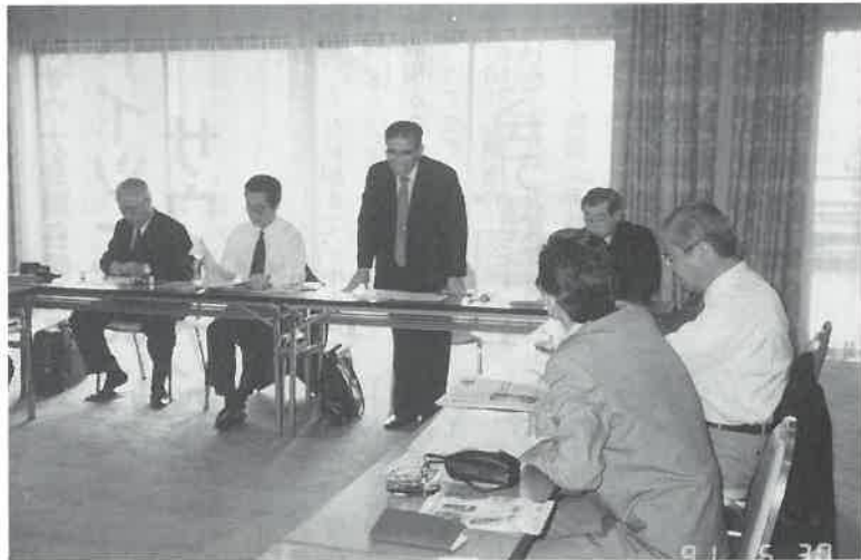
第4回理事会で活発に審議

発行所 社団法人日本サウナ協会総務部 大阪 06 (211) 0463 (直) FAX 06 (211) 4335 〒542 大阪市中央区道頓堀2-4-6 (三光ビル)