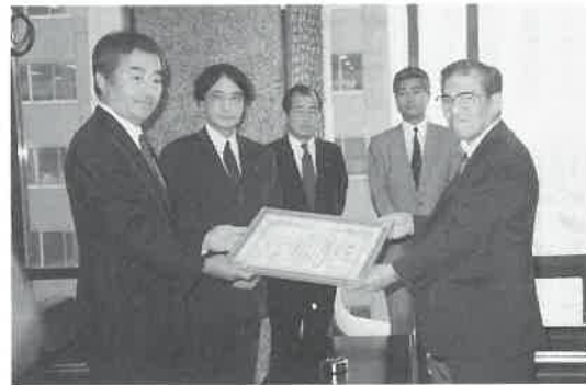
5月22日中野会長から国際サウナ会議に尽力された東京電通に感謝状が贈られた(同社会議室で)