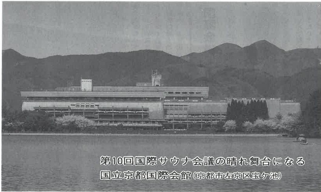
第10回国際サウナ会議の晴れ舞台になる 国立京都国際会館(京都市左京区宝ヶ池)

発行所 社団法人 日本サウナ協会総務部 大阪 06 (211) 0463 (直) FAX 06 (211) 4335 〒542 大阪市中央区道頓堀2-4-6 (三光ビル)