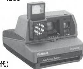
ポラロイドインパルスAF