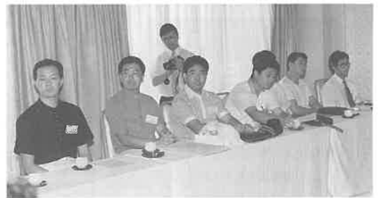
次代を担う青年部のメンバー