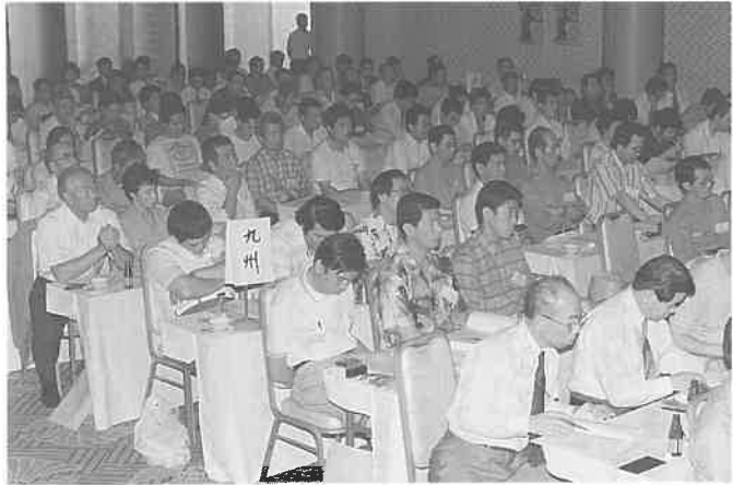
会場を埋めた会員さん