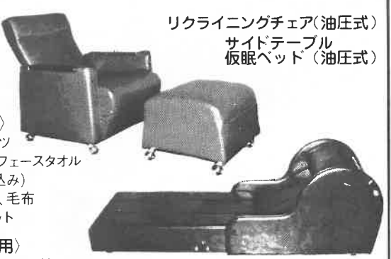
リクライニングチェア(油圧式) サイドテーブル 仮眠ベッド(油圧式)

〈サウナ用〉 ガウン、パンツ バスタオル、フェースタオル (名入れ織込み) タオルケット、毛布 サウナ室マット