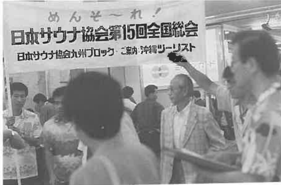
那覇空港での歓迎