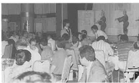
琉球舞踊を楽しみながら