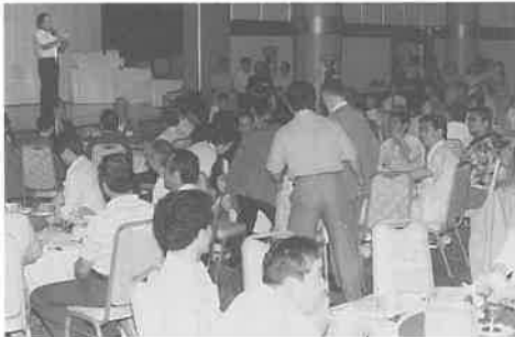
カラオケでにぎわう

二十九日、三十日には希望者が観光バスで、玉泉洞、博物館、万座毛、琉球村など沖縄の名所旧跡を訪ね、旅を楽しんだ。なかには石垣島まで足をのばす人もいた。