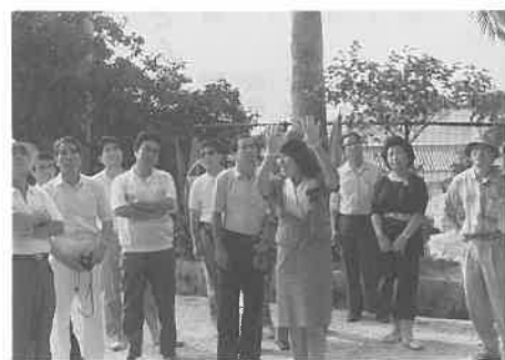
バスガイドさんの説明(守礼門で)

二十九日、三十日には希望者が観光バスで、玉泉洞、博物館、万座毛、琉球村など沖縄の名所旧跡を訪ね、旅を楽しんだ。なかには石垣島まで足をのばす人もいた。