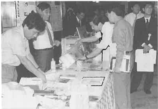
協賛会社の商品展示