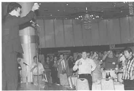
香西氏の音頭で祝杯