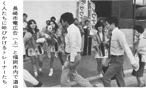
長崎市電広告(上)と福岡市内で道ゆく人たちに呼びかけるトレーナーたち

去る総会は下関ステーションホ テルサウナで開催しました。議題 は一、会員増強 二、サウナ祭り 三、不況対策 四、省エネ対策な ど、熱心に討議されました。小都 市のサウナとして厳しい状況で生 き残って行くにはどうしたらよい か。地方のサウナ協会として日本 サウナ協会との接点をどこに見つ けるか。本当に難しい問題ばかり です。とにかく会員相互の店がうま くいかないとい協会もさびれます。 県協会でもっと会合をもち、知恵 と情報を交換し合って、お互いの 経営に役立たせ、励ましあってい こうと言うことで閉会しました。 当地ではまだこの段階での足場固 めが急務のようです。