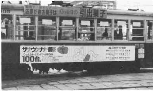
な反省と要望をとりまとめた。