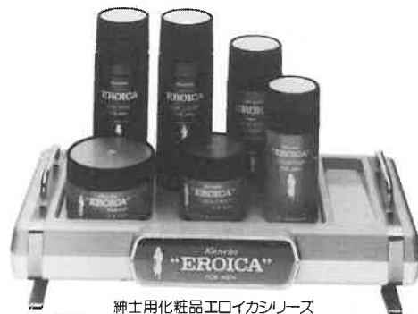
紳士用化粧品エロイカシリーズ

エロイカのあの独特の清涼感とまるやかさ、 心にゆとりを生む気品ある香り。英雄は英雄 を知るとか。エロイカは、おたたくのサウナに 一級のお客さまを呼ぶでしょう。