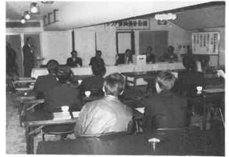
開西ブロックのサウナ祭抽選会は十一月三日ニュージャパン会議室で行われた。

今回の会合は十二月初めに忘年会を兼ねて開催する事となり、その時の議題として、年末年始営業方針を各店が発表、出来ることから足並みを揃える事を約束した。