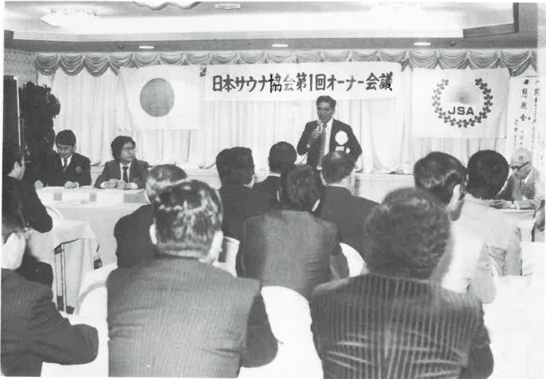
新しい魅力ある店づくりはいかにあるべきか＝第1回オーナー会議であいさつする中野会長