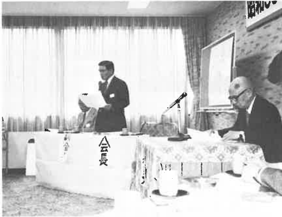
事業計画を説明する中野副会長