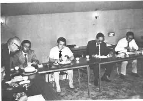
事業推進委員会にて