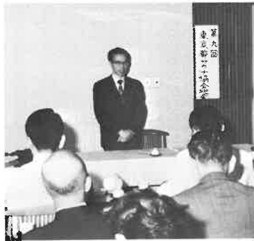
議長の方今井都協会会長

力説、「公害規制のやかましい都会地で特A重油から切替えるには、未だ難問も多いと思われるが、少く共B、C重油については、間違いなく優秀な成果を得ていることは北九州市でも証明されており、また東京都内の一般公衆浴場がほとんど「油水調合油」の使用に切替えている実状でもはつきりしている」と説明され、会場に出席されていた会員のなかにも、すでに切替えに踏み切った方もありました。中近東重油の輸入規制から、質の落ちるメキシコ等の重油が多くなるにつれて、油水調合の問題が大きくクローズアップされてくる