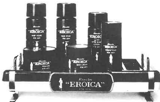
紳士用化粧品エロイカシリーズ

エロイカのあの独特の清涼感とまろやかさ、 心にゆとりを生む気品ある香り。英雄は英雄 を知るとか。エロイカは、あたくのサウナに 一級のお客さまを呼ぶでしょう。