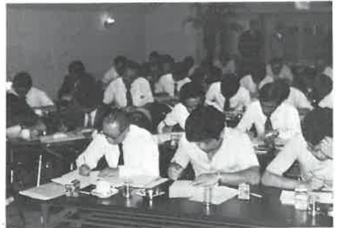
研修のしめくり——レポートの作成

◎現代は成熟社会である。ゆえにモノよりサービスを求める。サービスの経済化の時代である。昭和四十年頃よく売れた3Cは、