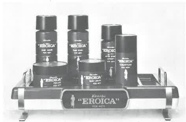
紳士用化粧品エロイカシリーズ

エロイカのあの独特の清涼感とまろやかさ、心にゆとりを生む気品ある香り。英雄は英雄を知るとか。エロイカは、おたくのサウナに一級のお客さまを呼ぶでしょう。