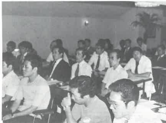
熱心に聞いている参加者