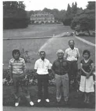
ジュネーブ大学にて

にこれほどすぐれたものはないので、もっとPRを強化すべきであるとのありがたいご意見もありました。また今回の催しについても、サウナ人口開発の意味から実に当を得たものであったというお話でした。