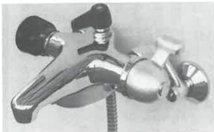
カジノシャワーK-500AT 混合栓M-300AT