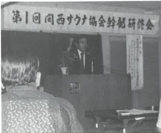
中野関西協会会長のあいさつ