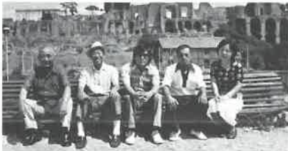
パラティオの丘を背景に(ローマ)