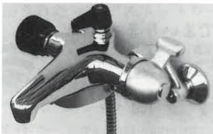
カジノシャワー-K-500AT 混合栓M-300AT