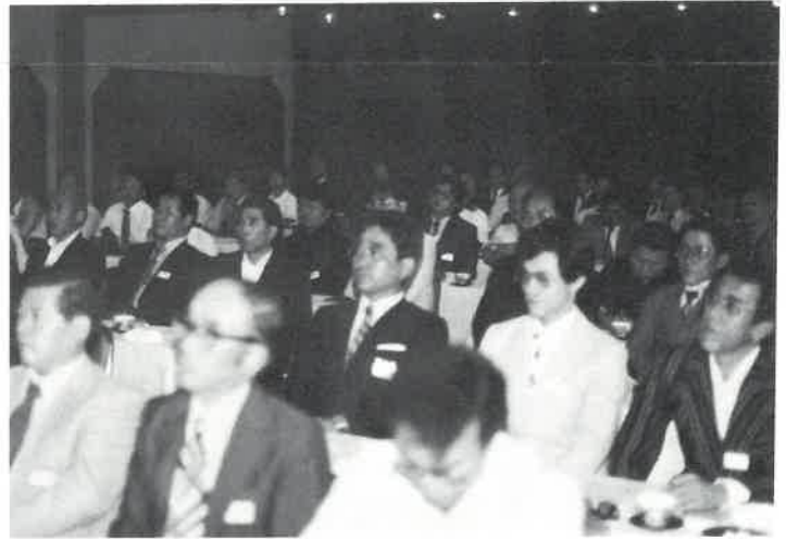
▶全国から七六名が参加した

次に大山専務理事より、全国統一規模で行なう『サウナ祭り』について協力要請がなされ、今後のすべての事業活動は事業推進委員会を中心