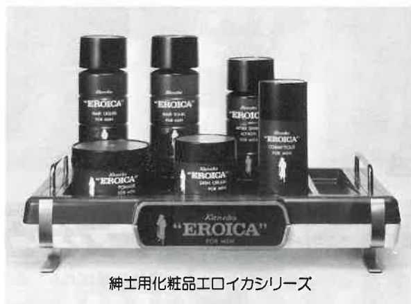
紳士用化粧品エロイカシリーズ

エロイカのあの独特の清涼感とまろやかさ、心にゆとりを生む気品ある香り。英雄は英雄を知るとか。エロイカは、あたくのサウナに一級のお客さまを呼ぶでしょう。