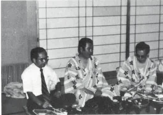
▲日ごろの仕事も少々忘れて…

あとはそれぞれ、お祭り広場で民謡を楽しむ者、北陸のすばらしい温泉に来てまでも忘れられない四人ゲームに興ずる者等々――懇親の度を大いに深めながら、北陸山代温泉の夜は静かに更けて