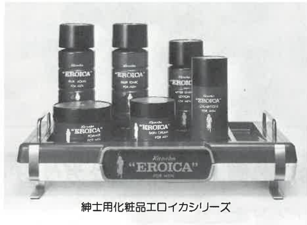
紳士用化粧品エロイカシリーズ

エロイカのあの独特の清涼感とまろやかさ、心にゆとりを生む気品ある香り。英雄は英雄を知るとか。エロイカは、おたくのサウナに一級のお客さまを呼ぶでしょう。