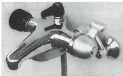
カジノシャワーK-500AT 混合栓M-300AT