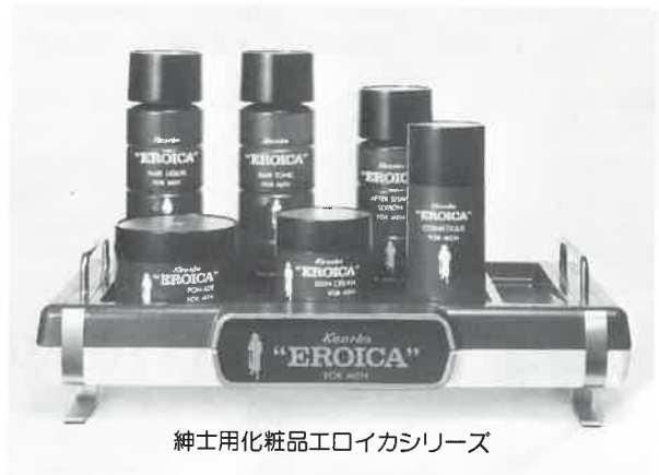
紳士用化粧品エロイカシリーズ

エロイカのあの独特の清涼感とまるやかさ、 心にゆとりを生む気品ある香り。英雄は英雄 を知るとか。エロイカは、あたくのサウナに 一級のお客さまを呼ぶでしょう。