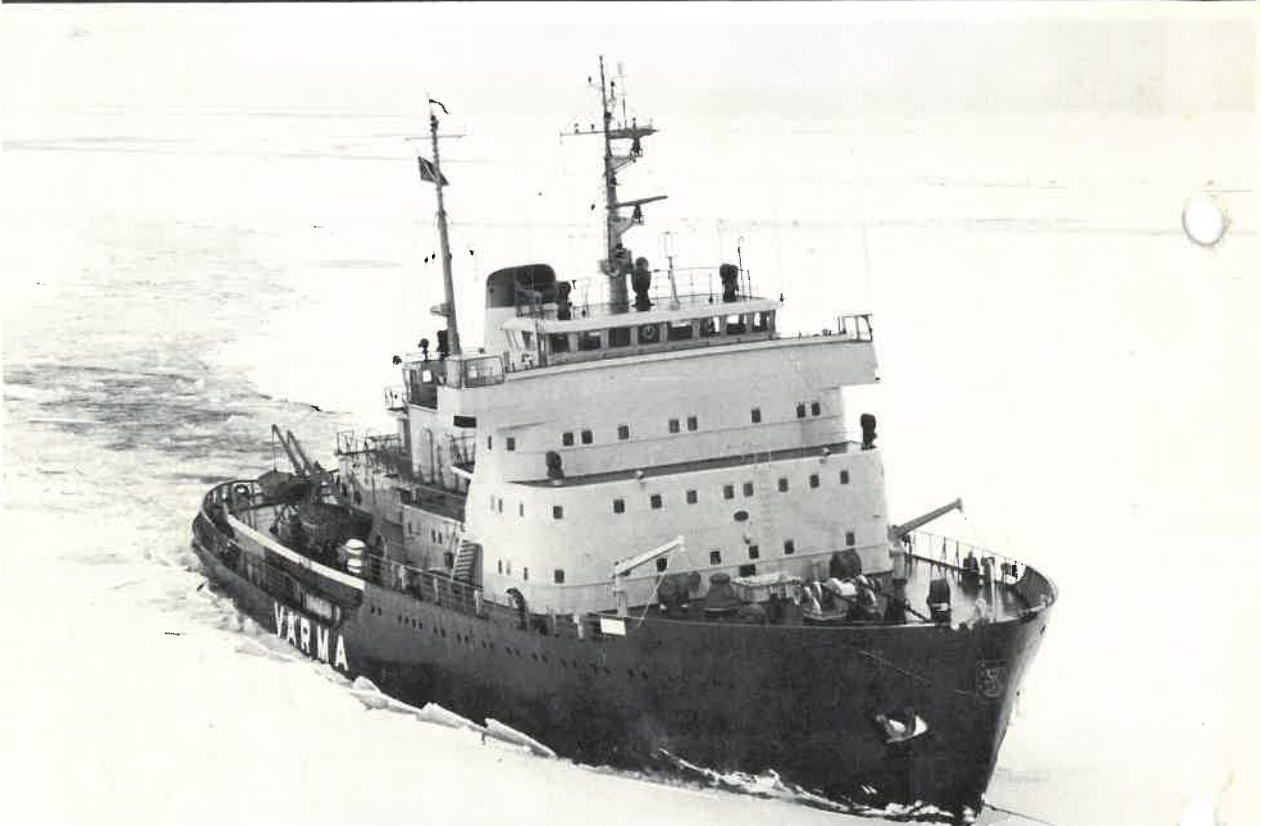
砕氷船ヴァルマ号(1969年竣工)