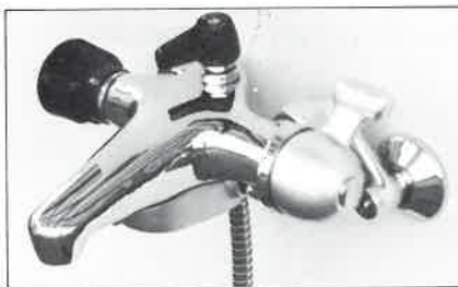
カジノシャワーK-500AT 混合栓M-300AT