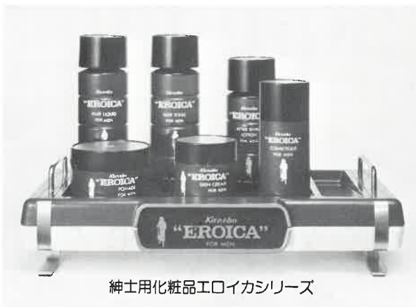
紳士用化粧品エロイカシリーズ

エロイカのあの独特の清涼感とまろやかさ、 心にゆとりを生む気品ある香り。英雄は英雄 を知るとか。エロイカは、おたくのサウナに 一級のお客さまを呼ぶでしょう。