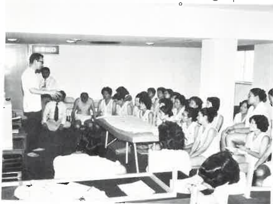
たしかな技術が大切

☆なお詳細については事務局までお問い合わせください。各地域での研修日は決定次第お知らせいたします。