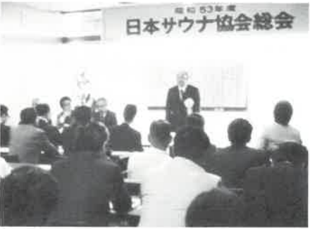
日本サウナ協会総会