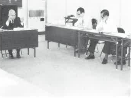
東京都サウナ協会