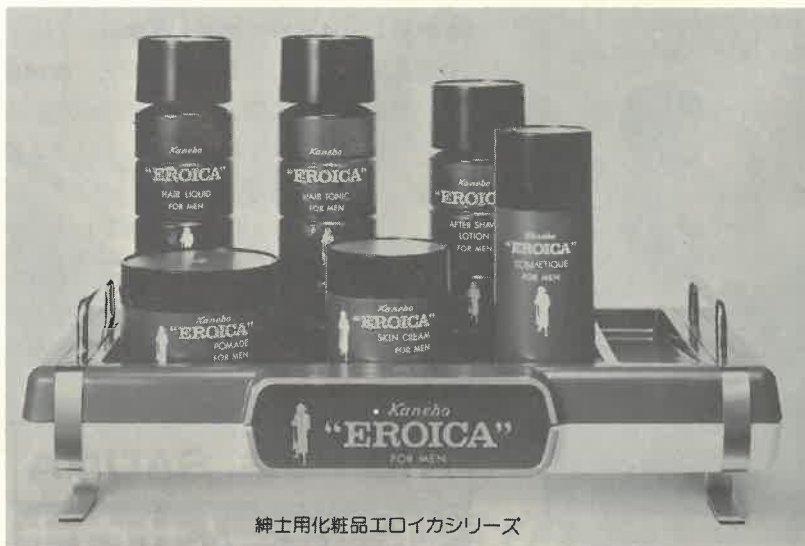
紳士用化粧品エロイカシリーズ

エロイカのある独特の清涼感とまろやかさ、心にゆとりを生む気品ある香り。英雄は英雄を知るとか。エロイカは、おたくのサウナに一級のお客さまを呼ぶでしょう。