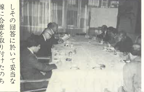
サウナ協会連合会役員会

三、ジュース、コーラ等の無料サービス廃止の件。永年の慣習上継続していた無料サービスを本年三月一日より廃止することに全員賛成で決定し、目下協会名のポスター製作中。四、駐車場無料サービス廃止の件。この件に関しては、各人各様の意見が出たが、スぺー