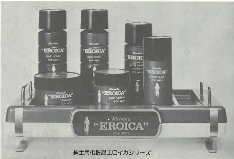
紳士化粧品エロイカシリーズ

エロイカのあの独特の清涼感とまろやかさ、心にゆとりを生む気品ある香り。英雄は英雄を知るとか。エロイカは、あたくのサウナに一級のお客さまを呼ぶでしょう。