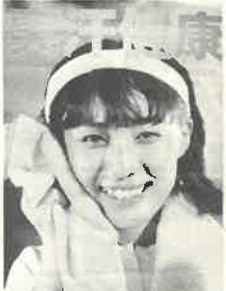
健康と信頼をお約束する日本サウナ協会