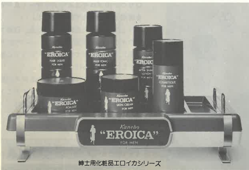
紳士用化粧品エロイカシリーズ

エロイカのあの独特の清涼感とまるやかさ、心にゆとりを生む気品ある香り。英雄は英雄を知るとか。エロイカは、おたくのサウナに一級のお客さまを呼ぶでしょう。