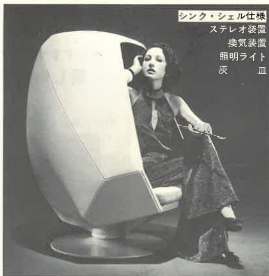
シンク・シェル仕様 ステレオ装置 換気装置 照明ライト 灰 皿