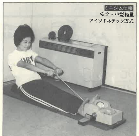
ミニジム仕様 安全・小型軽量 アイソキネティック方式

私達を取り囲んでいる生活空間はあまりに過密で騒がしすぎます。お客様はひとり静かに思索にふける、音楽に浸る、本を読む、そして眠る……。気ままにそういうことができる場所を求めています。