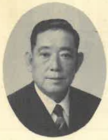
元厚生大臣 日本サウナ協会連合会名譽会長