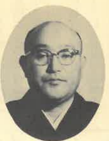
日本サウナ協会連合会会長