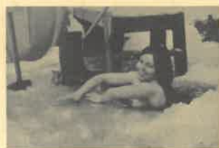
この雪穴の若い奥さんのようにすれば、もう一寸ばかりのイライラはふっ飛んで健康そのもの。

サウナは古代フィンランド人移住者達のさまざまな喜びや苦難を見つめてきた。焼き畑を踏みならしたり、打穀を行っていた当時は、毎晩サウナが暖められ、そのスチームが重労働で堅くなった筋肉をほぐしたものであった。