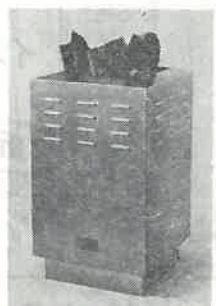
サウナ・ストーブ F3型