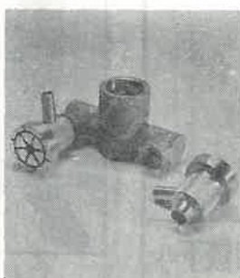
超音波発生ノズル付属品