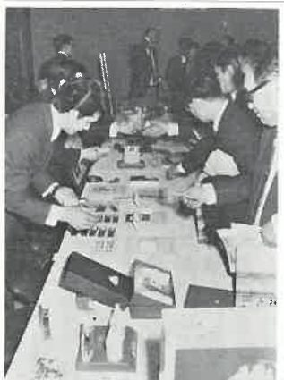
2月19日東京で開かれた「サウナ用品展示会」の様相

全国サウナ浴場協会事務局「ヨ」を、六月中旬に開く局では、サウナ営業施設向ことを予定している。 サウナ施設にとっては、