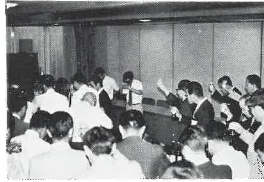
なごやかな懇親会パーティー

入った。社会情勢の変動に対応しサウナ業界の健全な発展を期すべく、各種の意見や提案が交わされた。とくに協会会員の拡張をはかるため広く同業者に働きかけることに意見の一致をみた。