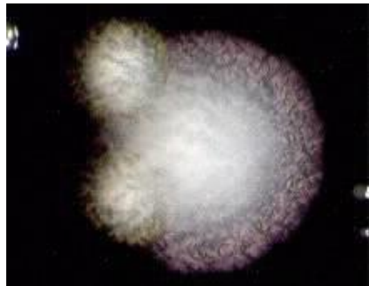
図3 実体顕微鏡で観察される1個の 大きな L. pneumophila 血清群1と 2個の L. cherrii の集落。 集落周縁部がモザイク・カットグラ ス様を呈する。