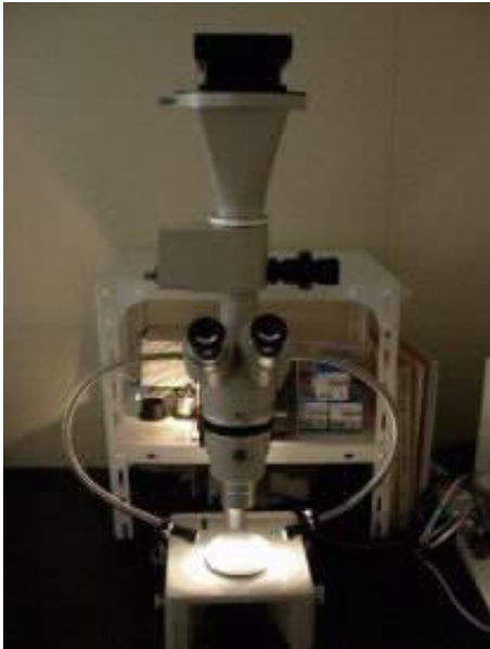
図2 斜光法による分離培地上の 集落観察